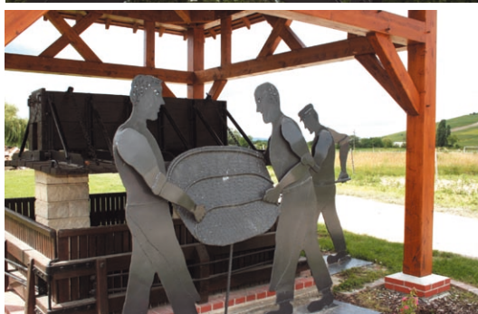
les raisins au pressoir

Ces sculptures ont été réalisées avec le soutien de