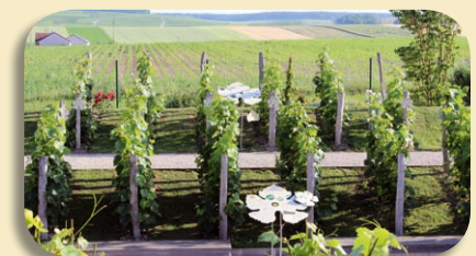
vignoble champenois miniature