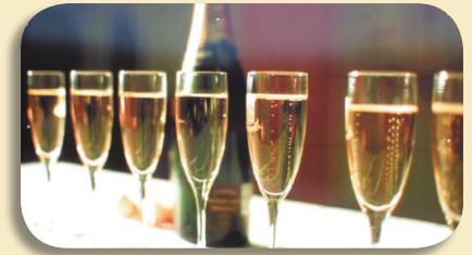
exposition de photos géantes