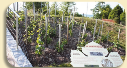
vigne en foule