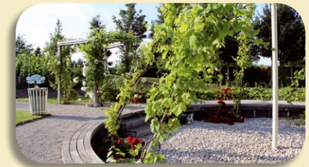
évolution des modes de conduite