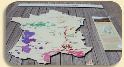
carte des vignobles de France